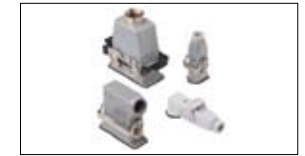
Industriële Connectoren ILME