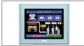
HMI Producten IDEC Touchpanels