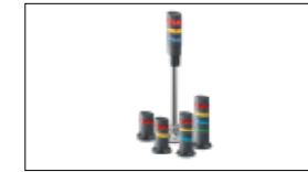
Signaleringen IDEC LD6A & SpiderLED