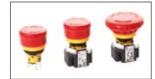
Noodstopeschakelaars IDEC X-serie