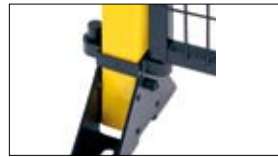
Machineafscherming Safetec diS