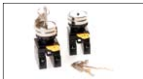
Drukknoppen IDEC YW-serie