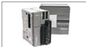
PLC Besturingen IDEC MicroSmart