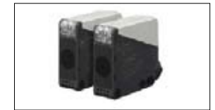
Sensoren IDEC SA1E & SA1U