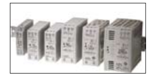
Schakelkast componenten IDEC PS-voedingen & R-serie relais