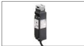
Hekbewakingen IDEC HS-serie