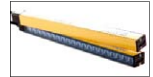
Veiligheidslichtschermen CEDES safe4 & safe400