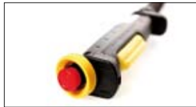
Vrijgaveschakelaars IDEC HE-serie